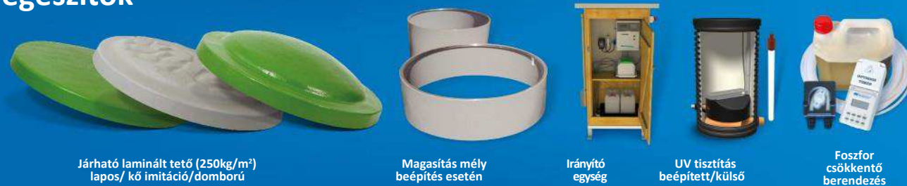
Járható laminált tető (250kg/m 2 ) lapos/ kő imitáció/domború